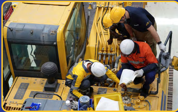
Training & Service Support