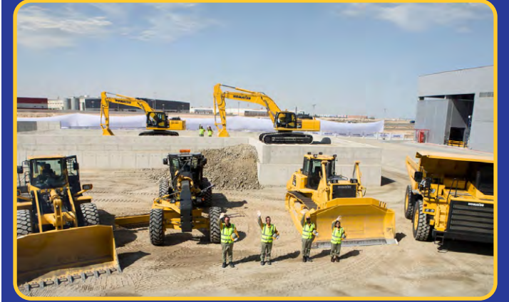
مركز عرض الآليات