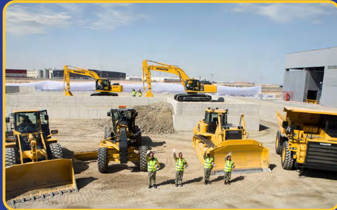
Machine Demonstration Center