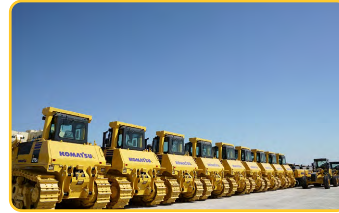
مركز دبي لعمليات التخزين

يستعرض مركز دبي لعمليات التخزين (DSO) كل ما يتعلق بالجودة والتميز في إدارة العمليات. نحن نقدم حلولًا متكاملة لتلبية احتياجات عملائنا في منطقة الشرق الأوسط وشمال أفريقيا Wallenius Wilhelmsen (WW). فخورة بتقديم خدماتها المتميزة التي تضمن رضا العملاء وتحقق أعلى مستويات الكفاءة.