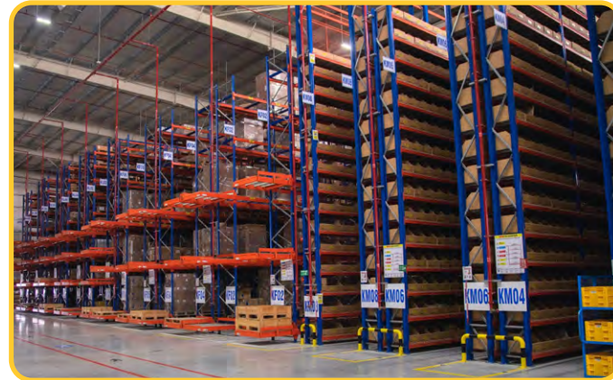
Regional Parts Distribution Center