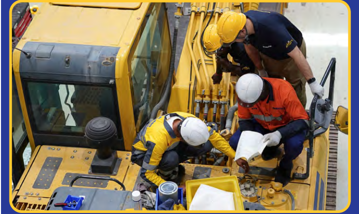
التدريب والدعم الفني